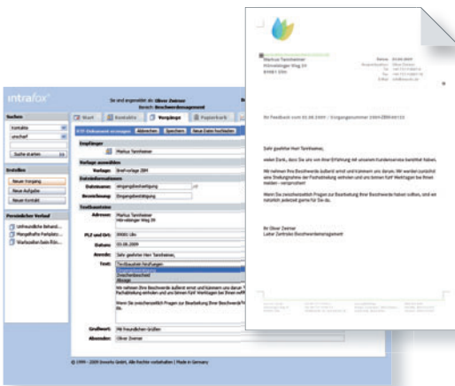
Abbildung: Erstellung von fertigen Anschreiben direkt aus dem System