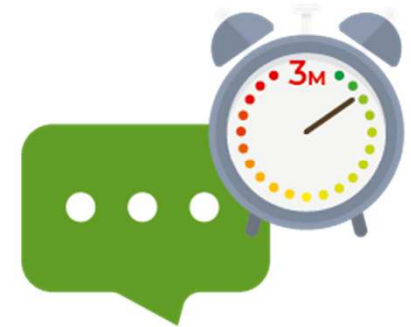
Rückmeldung (binnen 3 Monaten)

Bis zum bis 17.12.2021 muss die EU-Hinweisgeber-Richtlinie (2019/1937) in nationales Recht umgesetzt werden