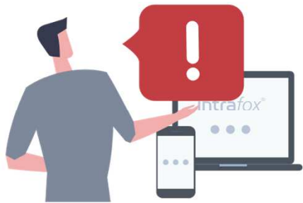
Meldung ins Hinweisgeber-System

Welche Fristen sind beim interne Meldeverfahren zu berücksichtigen?