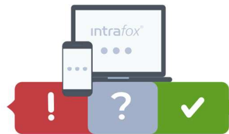
Meldungsbearbeitung und Kommunikation